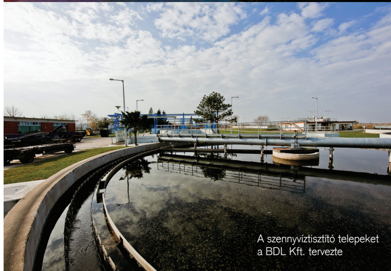
A szennyvíztisztító telepeket a BDL Kft. tervezte