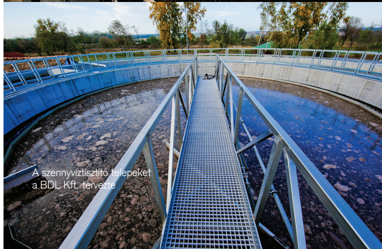
A szennyvíztisztító telepeket a BDL Kft. tervezte