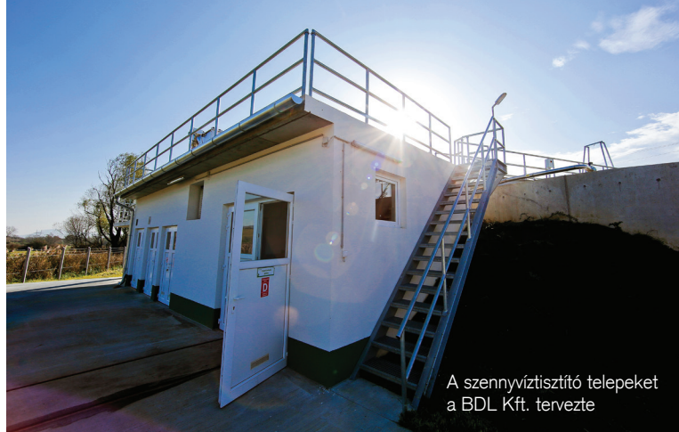
A szennyvíztisztító telepeket a BDL Kft. tervezte